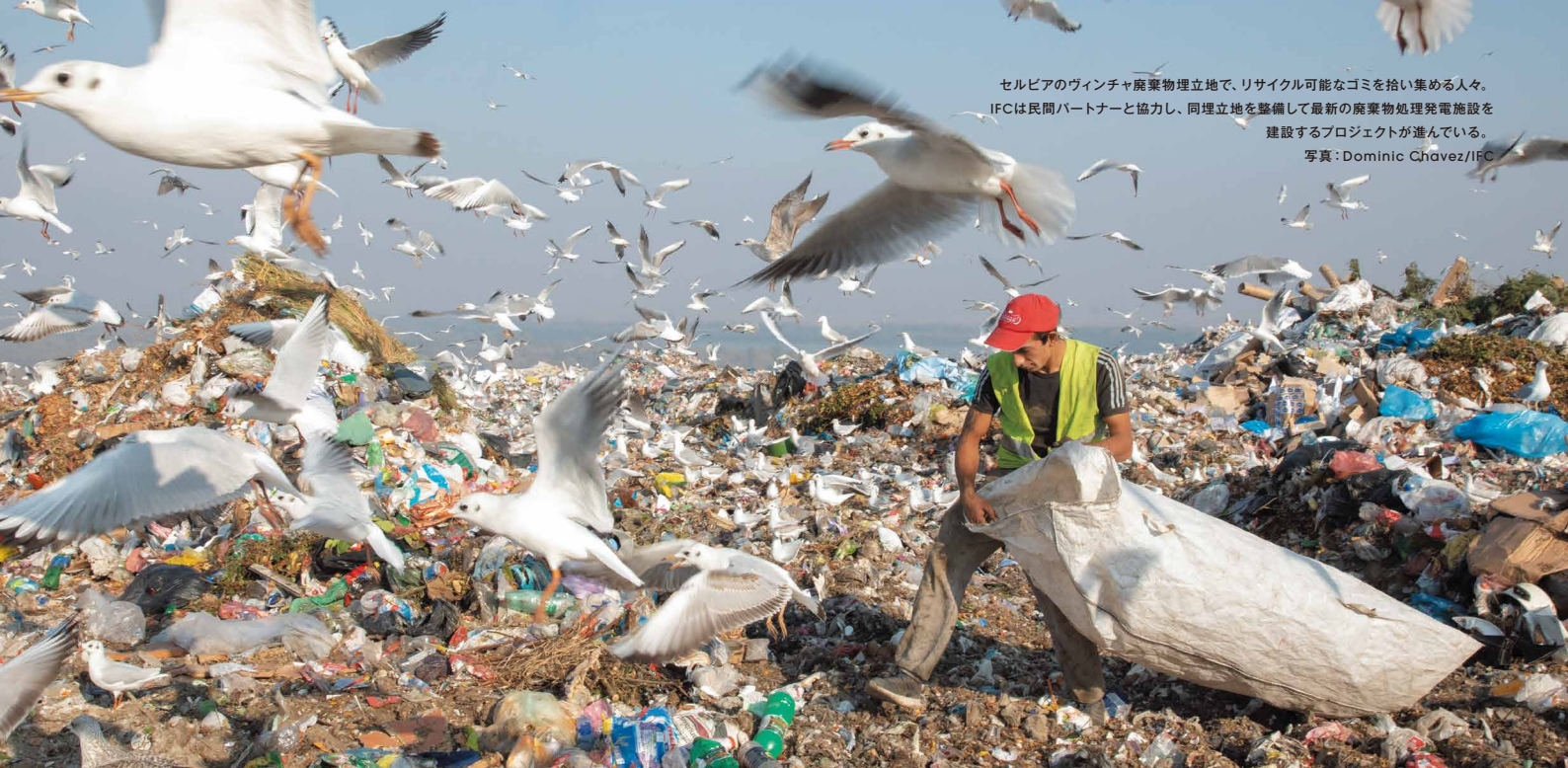
セルビアのヴィンチャ廃棄物埋立地で、リサイクル可能なゴミを拾い集める人々。 IFCは民間パートナーと協力し、同埋立地を整備して最新の廃棄物処理発電施設を 建設するプロジェクトが進んでいる。