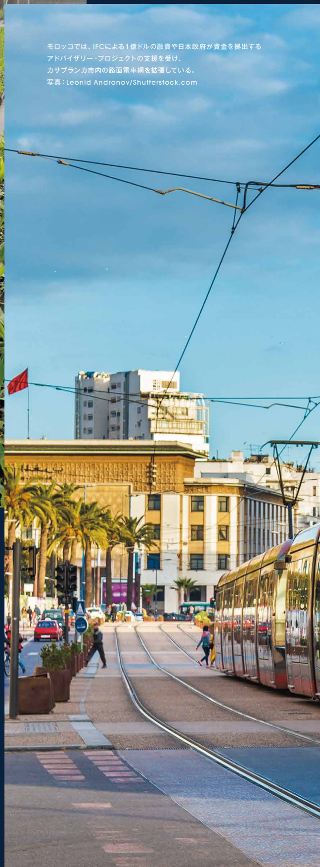
モロッコでは、IFCによる1億ドルの融資や日本政府が資金を拠出する アドバイザー・プロジェクトの支援を受け、 カサブランカ市内の路面電車網を拡張している。