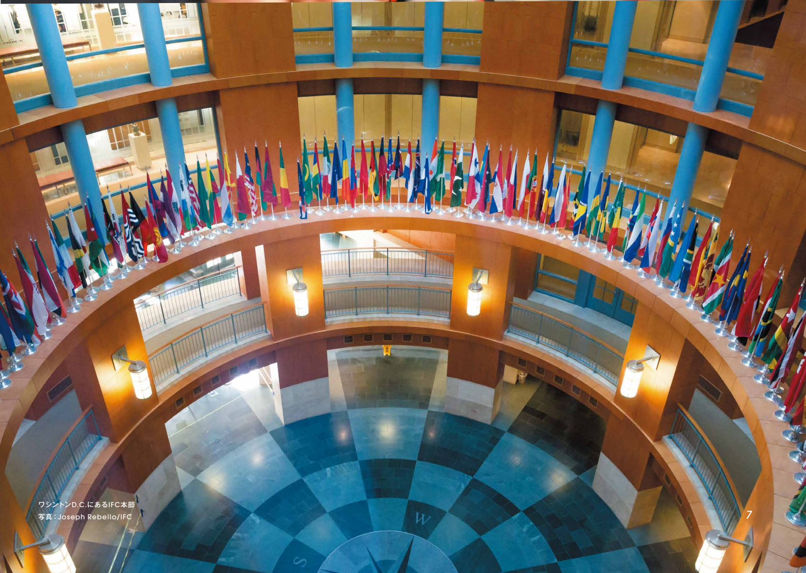
ワシントンD.C.にあるIFC本部