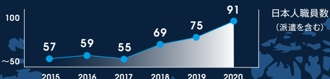
増加するIFCの日本人職員採用数

将来のキャリアの選択肢としてIFCの認知を高め、優秀で高いモチベーションを持つ日本人を採用するべく、IFCは毎年、日本で採用活動を行っており、採用に関する説明会やイベント等も随時開催しています。IFCの採用に関する詳細は、 ifc.org/careers をご参照ください。