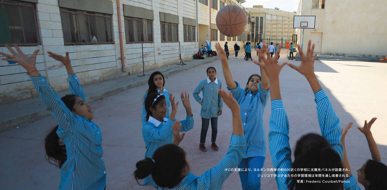
IFCの支援により、ヨルダン川西岸の約500近くの学校に太陽光パネルが設置され、ジェリコで学ぶ少女たちの学習環境は年間を通し改善される。

持続可能な開発目標を達成するには、年間最大4兆ドルが必要とされています。これは、ドナー国が政府開発援助（ODA）を通じて支援する額をはるかに上回り、債務残高の大きい途上国が自国の公的資源から拠出できる額をもはるかに超えます。それゆえに、民間資本を大規模に、かつてないほど幅広い国々から動員することが不可欠となります。