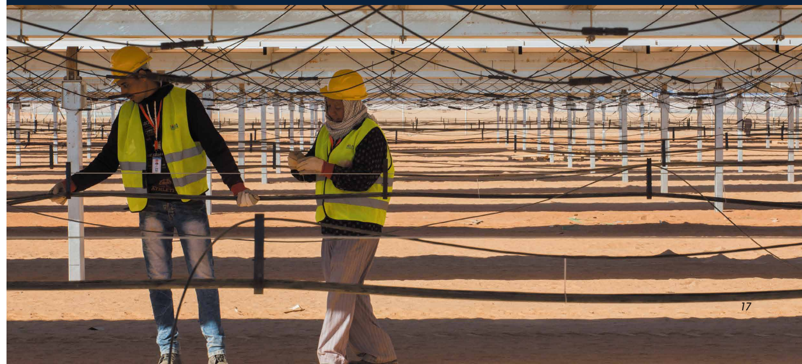
エジプトのベンバン太陽光発電施設の配線作業をする作業員。 IFCが融資する同施設は、エジプトの持続的な経済成長に必要なクリーンエネルギーを供給する。

川上段階での取組みは、主に大きな格差のあるセクターに注力しています。将来的な投資機会に対する明確な見通しを持って、政策と規制環境の整備に向けて、世界銀行グループ全体で連携を図っています。単に融資の要請に応えるだけでなく、セクターの規制改革の進展に伴い、収益性の見込めるプロジェクトの創出に取り組んでおり、具体的には、人々の生活環境を改善する革新的な民間セクターの解決策を策定し、実現可能性を見極めるとともに、それを実現するために共に取り組む投資家の動員などを行っています。