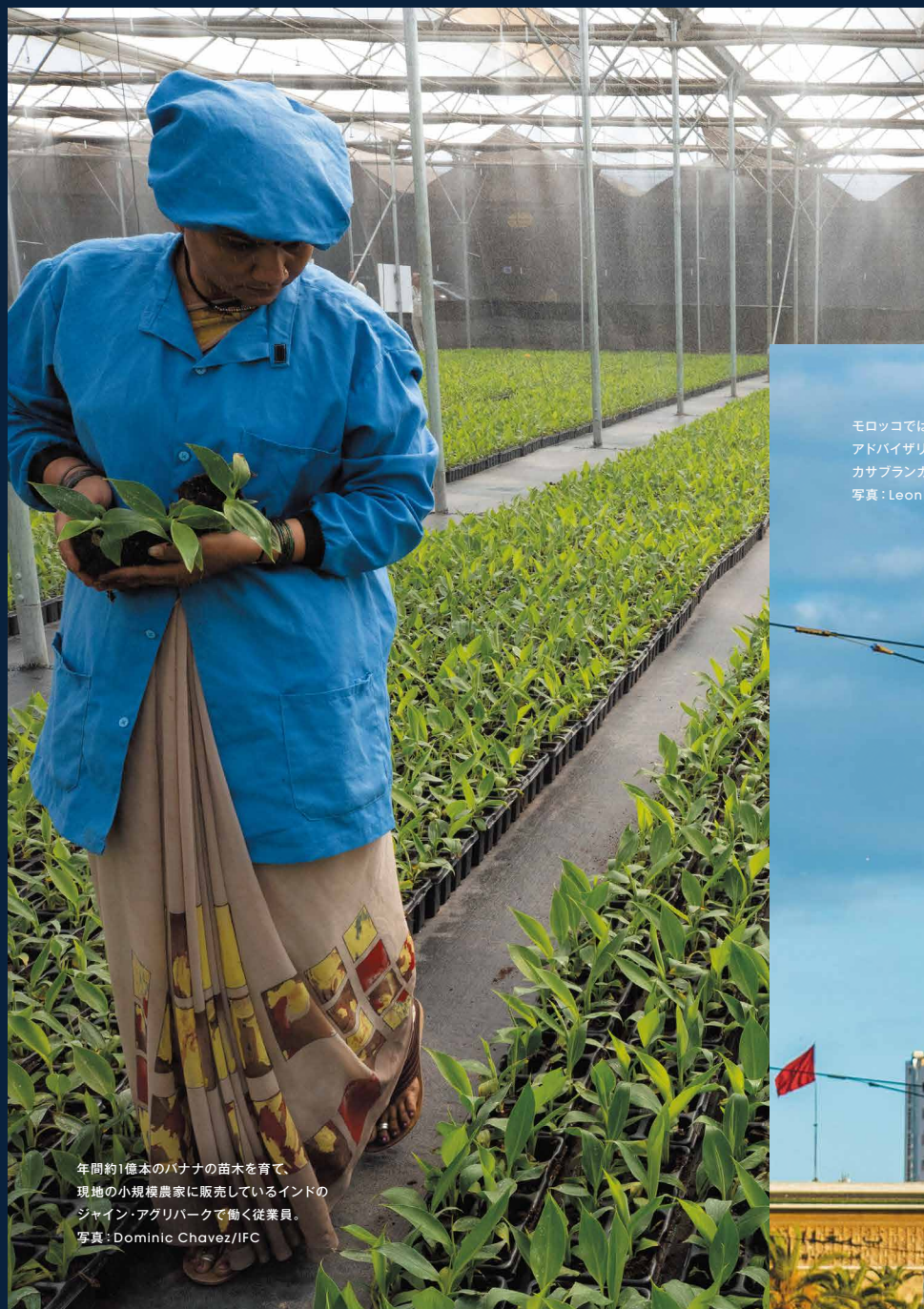
年間約1億本のバナナの苗木を育て、 現地の小規模農家に販売しているインドの ジャイン・アグリパークで働く従業員。