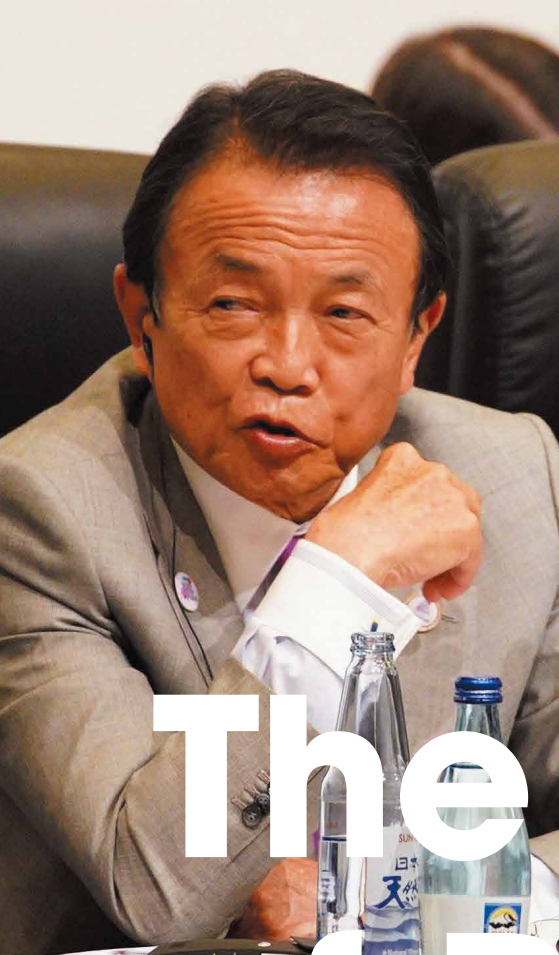
G20福岡 財務大臣・中央銀行総裁会議（2019年6月開催）に おいて議長を務める麻生太郎財務大臣

日本は1956年に設立メンバーとしてIFCに加盟し、世界銀行からの借入国からドナー、そしてIFCの取組みに不可欠な資金の拠出国へと変遷を遂げました。日本のパートナーシップは、民間セクターの力を活用して極度の貧困を撲滅し、途上国で繁栄を共有するためのIFCの取組みにおいて極めて重要です。