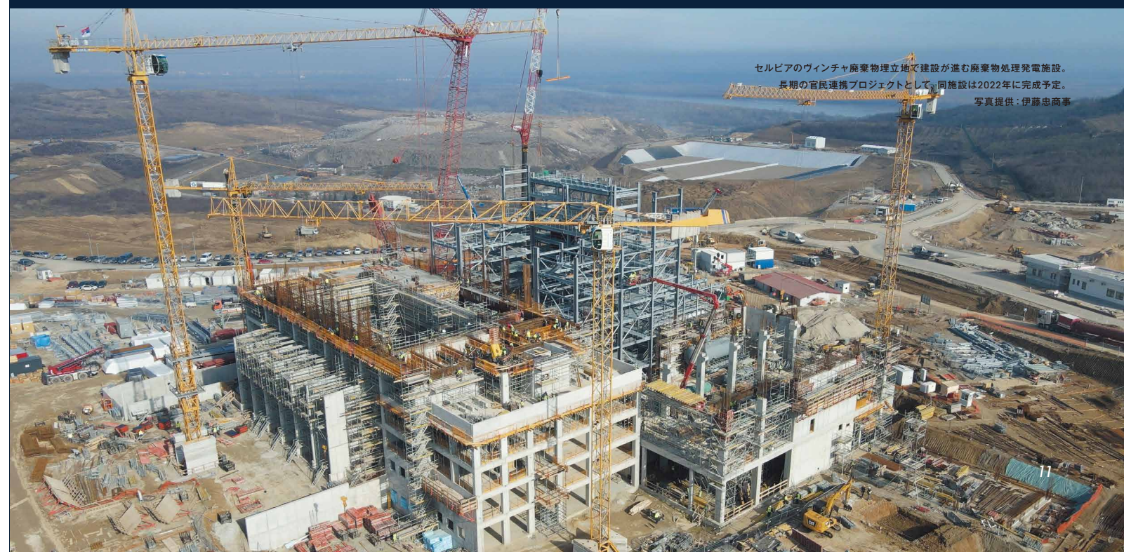
セルビアのヴィンチャ廃棄物埋立地で建設が進む廃棄物処理発電施設。 長期の官民連携プロジェクトとして、同施設は2022年に完成予定。

同融資と合わせて、包括的日本信託基金を通じた資金援助による、道路整備に関する技術支援や質の高いインフラ・プロジェクトに必要な環境的・社会的ガバナンスに関するアドバイザー業務も行っています。IFCは、さらに日本政府の支援を受け、現在この取り組みをモロッコのフェズ＝メクネス地域に拡大して同様のアドバイザー業務を展開しています。