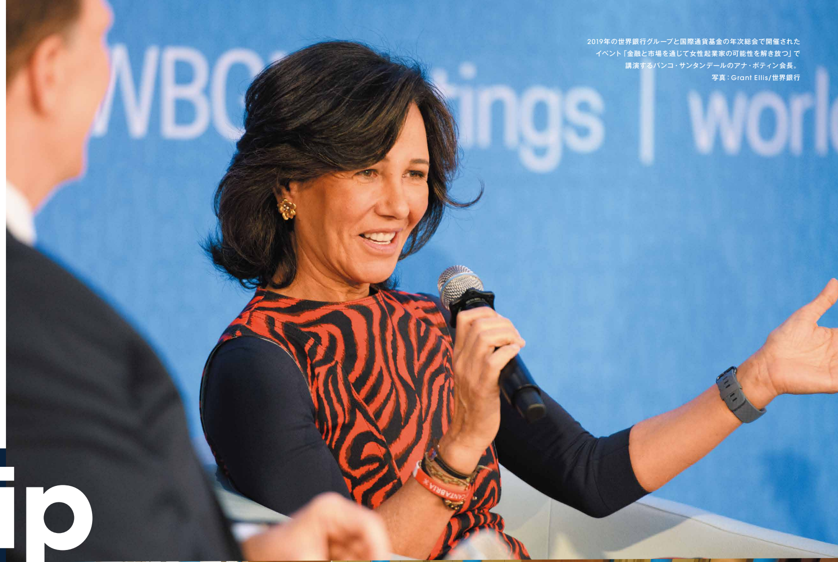
2019年の世界銀行グループと国際通貨基金の年次総会で開催された イベント「金融と市場を通じて女性起業家の可能性を解き放つ」で 講演するバンコ・サンタンデルのアナ・ボティン会長。

日本の公的な輸出信用機関である日本貿易保険（NEXI）も、重要なパートナーのひとつです。2020年に、IFCとNEXIは、貧困国や脆弱国における民間セクター主導の開発を共同で推進するための覚書を締結し、共通の事業地域における経済的及び社会的発展を支援する機会の開拓において協力することで合意しました。