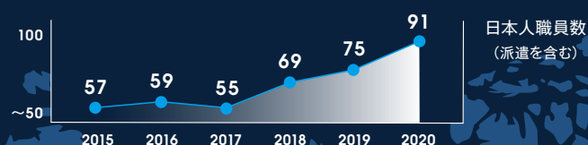
増加するIFCの日本人職員採用数

将来のキャリアの選択肢としてIFCの認知を高め、優秀で高いモチベーションを持つ日本人を採用するべく、IFCは毎年、日本で採用活動を行っており、採用に関する説明会やイベント等も随時開催しています。IFCの採用に関する詳細は、 ifc.org/careers をご参照ください。