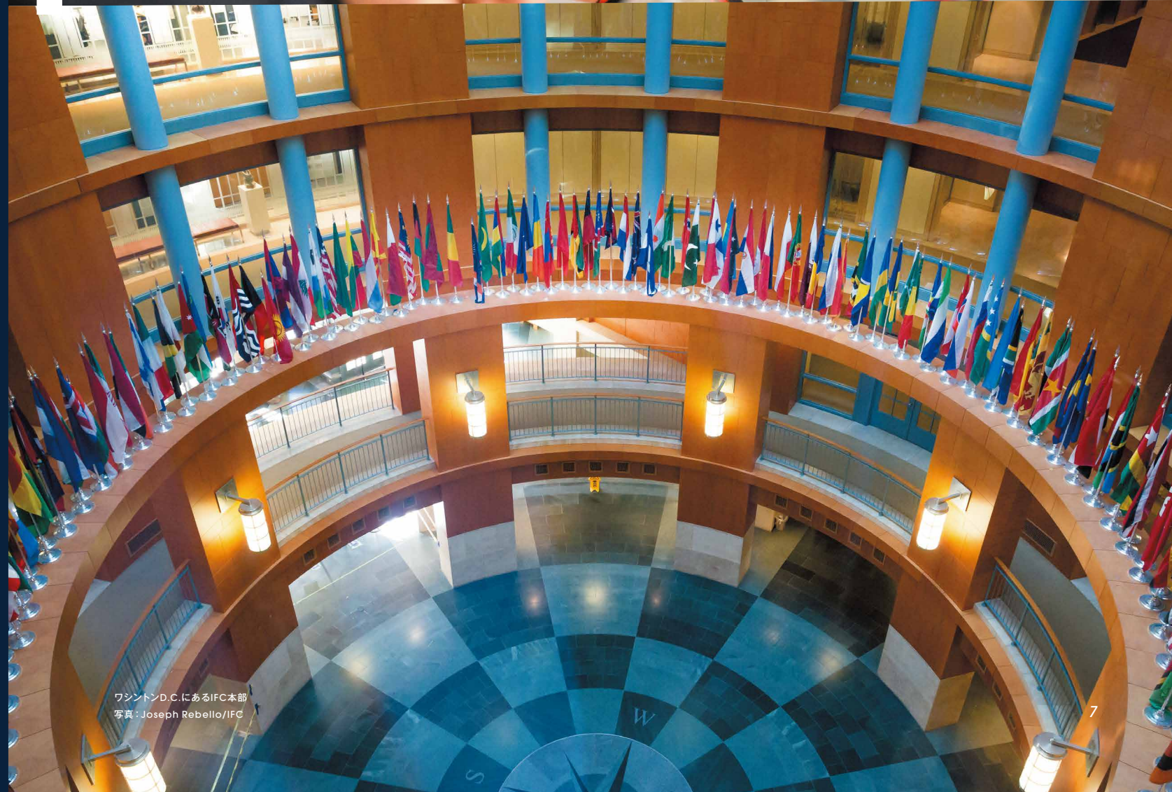
ワシントンD.C.にあるIFC本部