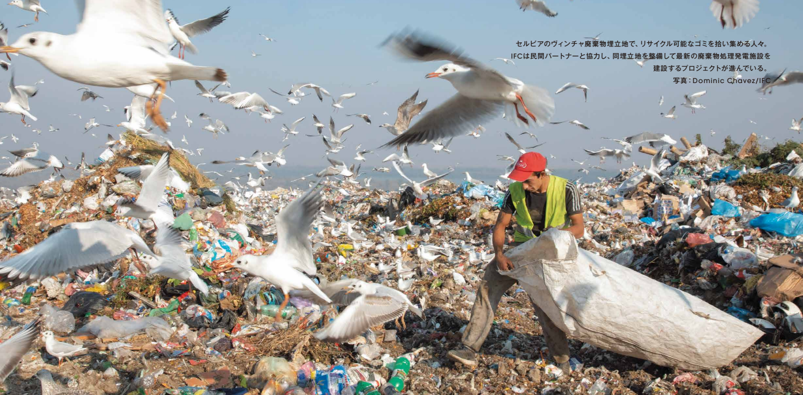
セルビアのヴィンチャ廃棄物埋立地で、リサイクル可能なゴミを拾い集める人々。 IFCは民間パートナーと協力し、同埋立地を整備して最新の廃棄物処理発電施設を 建設するプロジェクトが進んでいる。