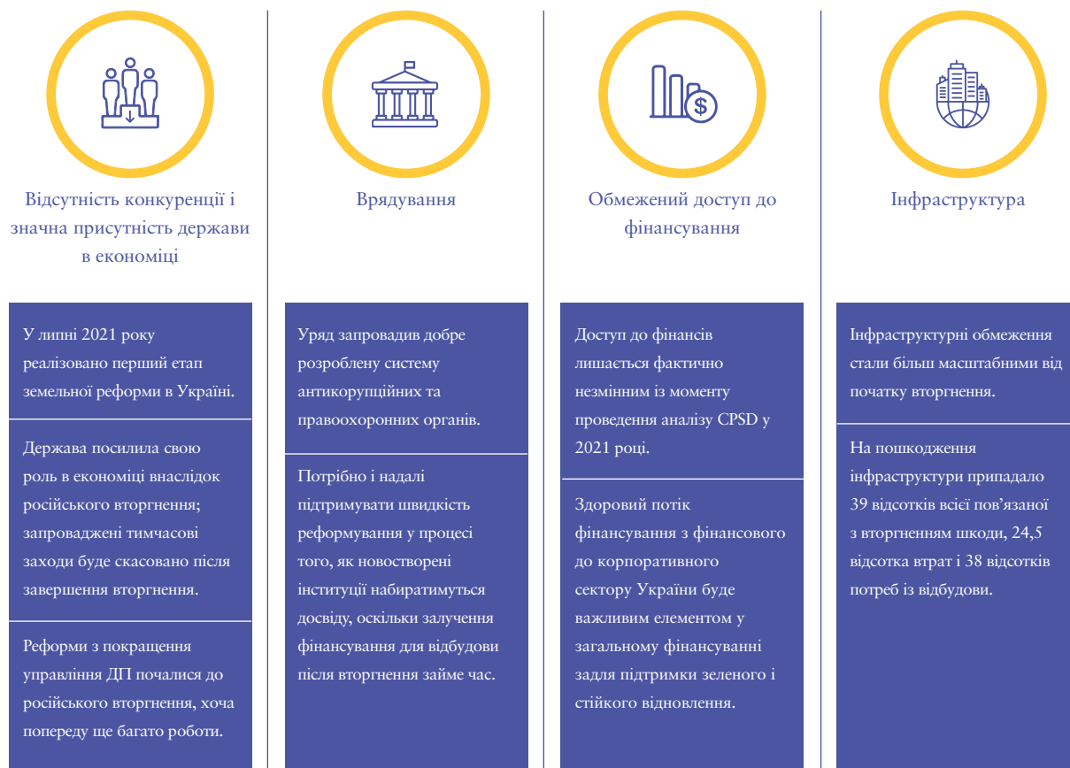
Рисунок 1. Оновлена інформація про обмеження щодо зростання приватного сектору, які було визначено під час аналізу приватного сектору у 2021 році