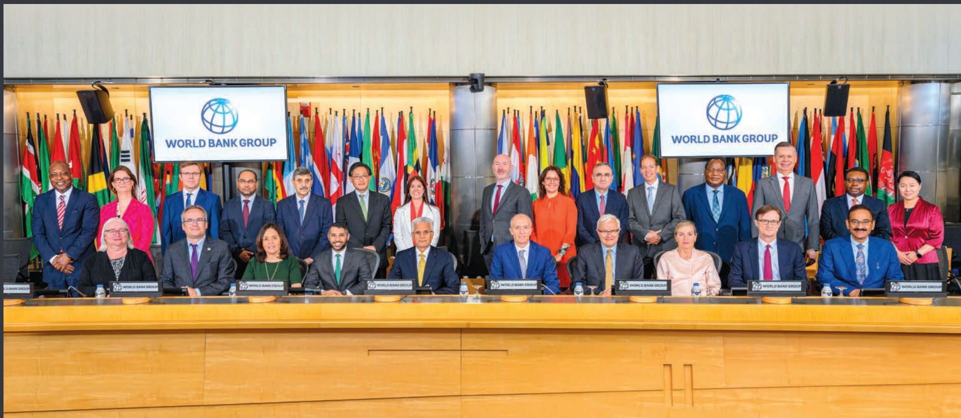
ФОТО НИЖНИЙ РЯД, СИДЯТ, СЛЕВА НАПРАВО: