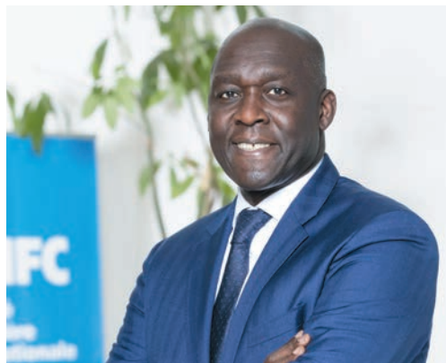
Махтар Диоп Управляющий директор IFC

Руководство IFC формирует стратегию и политику Корпорации и следит за эффективным размещением ее ресурсов, уделяя при этом особое внимание достижению максимальных результатов в области развития и удовлетворению потребностей ее клиентов. Высшее руководство IFC олицетворяет сплав многолетнего опыта работы в области развития, обширного спектра профессиональных знаний и взаимодополняющих культурных взглядов.