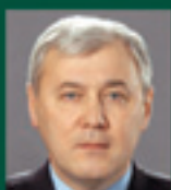
Анатолий Алексков, Зампред комитета по кредитным организациям и финансовым рынкам, Государственная Дума РФ

6 декабря 2005 ПРОЕКТ IFC УПРАВЛЕНИЕ БАНКОВСКИМИ РИСКАМИ В РОССИИ