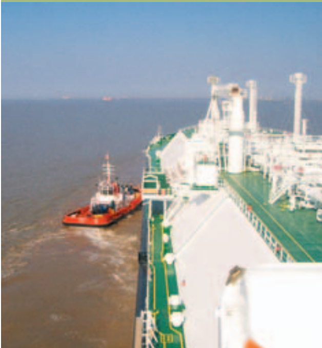
REPRODUCTION AUTORISÉE: SEALION SPARKLE