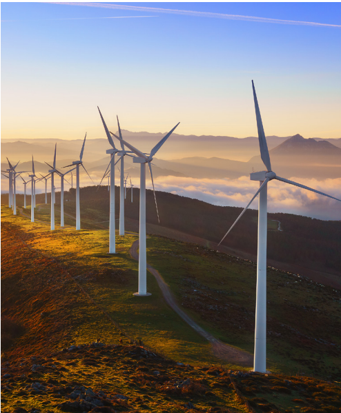
Torest, et explit, nienis dolorem vent. Istrum as in enda consequid utatest re dellab imagnienim inum que debitat.