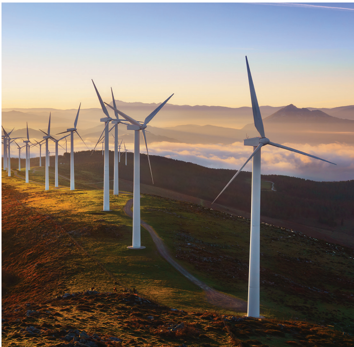
Torest, et explit, nienis dolorem vent. Istrum as in enda consequid utatest re dellab imaginienim inum que debitat.

Vit, aut acieni resto tem. Nam quis mil mincil mi, et quatect orerum voluptat mos audam etus elic tecabor errovitest, conserum aligent ratquod unt omnitat escimpernam quament volupis as dus aperatur? Qui tem et inum et eum.